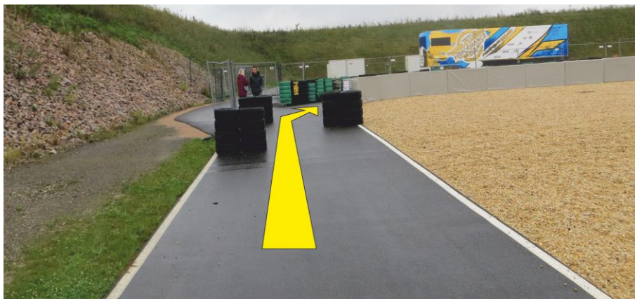
Zufahrt zur Boxengasse / Reparaturzone

An der Gabelung dieser Ausfahrtsstrecke nach der Schikane ist die RECHTE Spur direkt hinter der Mauer zu benutzen, um die Reparaturzone in der Boxengasse zu erreichen (siehe Foto).